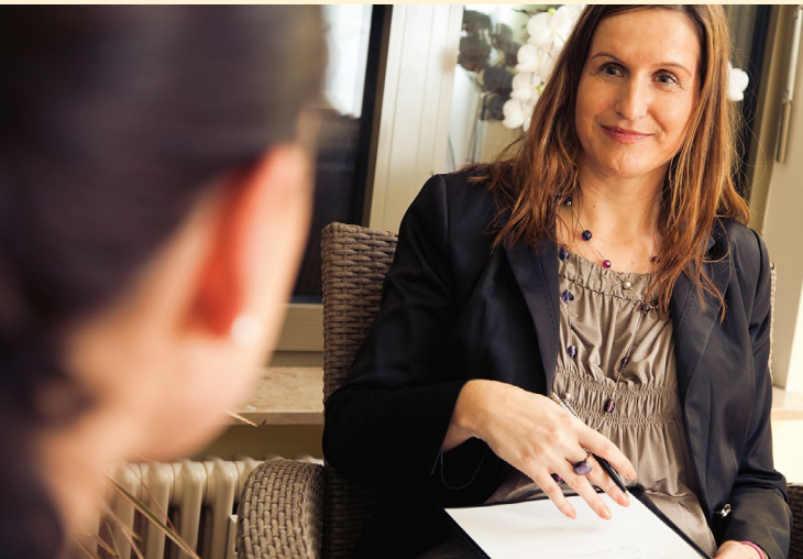
fit2work - Beratung, Kompetenz, neue Chancen

„Ich bin Personalentwicklerin in einem mittelgroßen Krankenhaus. Dank der fit2work Beratung konnten wir eine diplomierte Krankenpflegerin, die seit über 20 Jahren im Haus arbeitet und an einer komplizierten Krebserkrankung leidet, im Unternehmen halten. Zudem hat sie über fit2work Förderungen und unterstützende Beratung bekommen.“